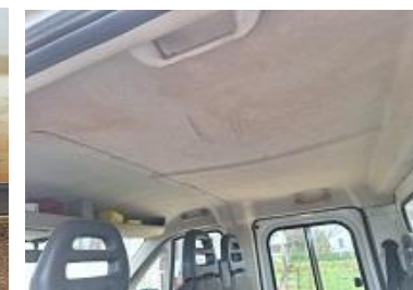
Pogled na vozilo PEUGEOT BOXER 2.0 120 BLUEHDI

Županijski sud: rješenje broj: 4 Su-1039/10 od 13. srpnja 2022.